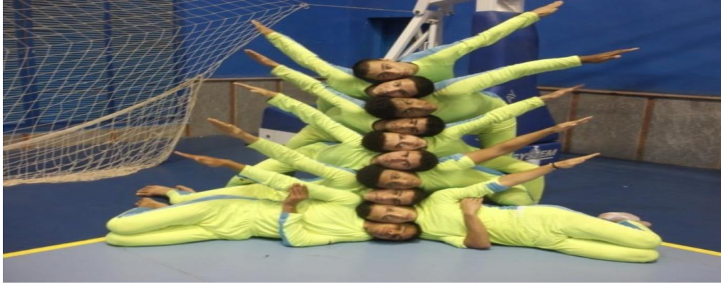
( تشكيلات حرة جماعية ) :