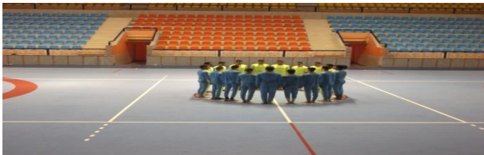
تشكيل الدوائر المتداخلة

وهو تشكيل بداية الدخول من أجناب الملعب حتى الوصول إلى دائرة منتصف الملعب . بداية تداخل القطارين عند نقطة منتصف الملعب. يمر عارض من قطار يمين المقصورة ثم عارض من قطار يسار المقصورة بالتوالي ويتم هذا التشكيل في (١٦) عدة أي ٨ \times ٢ مرفق (١)