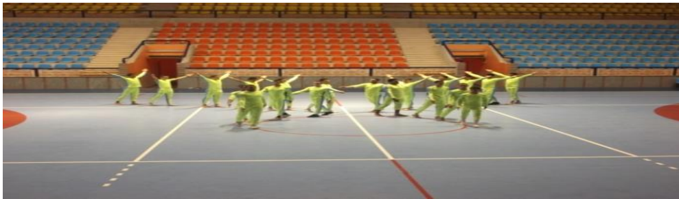
تشكيل القطارات المتداخلة -

وهو تشكيل بداية الدخول من أجناب الملعب حتى الوصول إلى دائرة منتصف الملعب . بداية تداخل القطارين عند نقطة منتصف الملعب. يمر عارض من قطار يمين المقصورة ثم عارض من قطار يسار المقصورة بالتوالي ويتم هذا التشكيل في (١٦) عدة أي ٨ \times ٢ مرفق (١)