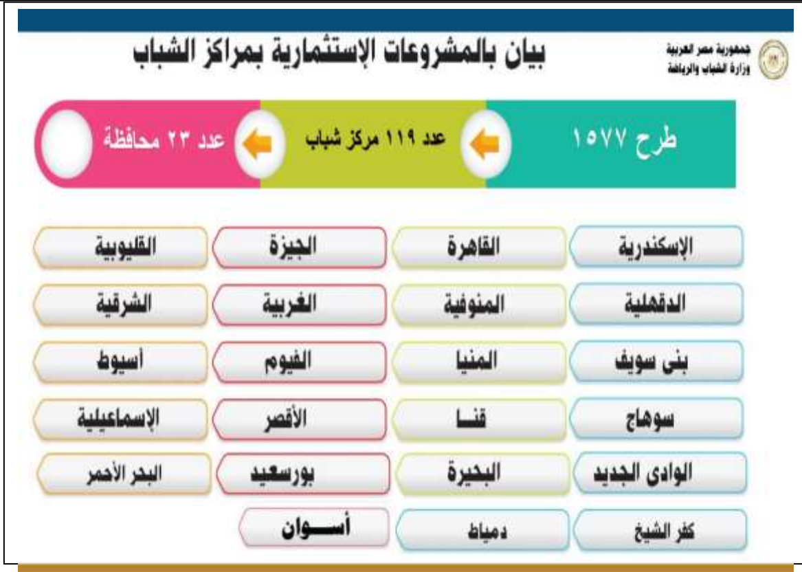
شكل ( ١ )

رسم بياني يوضح بعض المشروعات الاستثمارية بمراكز الشباب