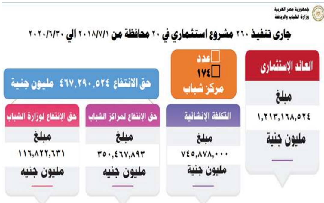
شكل ( ٢ )

رسم بياني يوضح بعض المشروعات الاستثمارية بمراكز الشباب