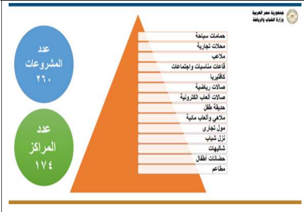
شكل ( ٣ )

رسم بياني يوضح المنشآت والإمكانات المستثمرة في بعض المشروعات الاستثمارية ويظهر من خلال تلك المشروعات المستحدثة اتجاه وزارة الشباب والرياضة إلى وضع رؤية مصر ٢٠٣٠ نصب أعينها وسعيها لتحقيق تلك الرؤية من خلال استحداث تلك المشروعات والسعي نحو تجويد الخدمات والقيام بالدور التنموي والاقتصادي والاجتماعي المنوط بها ، وبالتالي وجب الوقوف علي هذا الدور ومعرفة ما إذا كانت الوزارة تسير في الوضع الصحيح وما هي الجوانب التي لم تكتمل في هذه المشروعات لتحقيق رؤية مصر ٢٠٣٠م بكامل أهدافها التنموية والمستدامة . ومن هنا تظهر أهمية ومشكلة البحث في كونها محاولة للتعرف علي الدور التنموي والاقتصادي للمشروعات الاستثمارية المستحدثة بوزارة الشباب والرياضة ودورها في الارتقاء بالمنظومة الرياضية والشبابية في ضوء رؤية مصر ٢٠٣٠ .